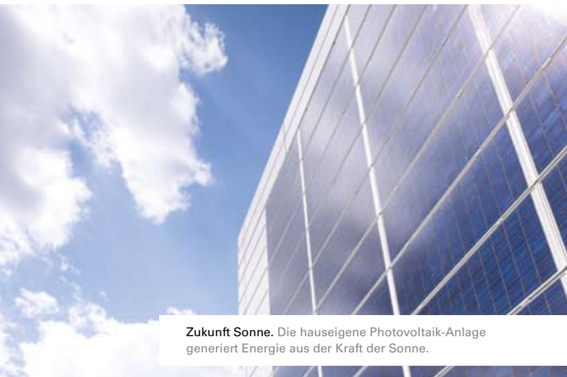
Zukunft Sonne. Die hauseigene Photovoltaik-Anlage generiert Energie aus der Kraft der Sonne.